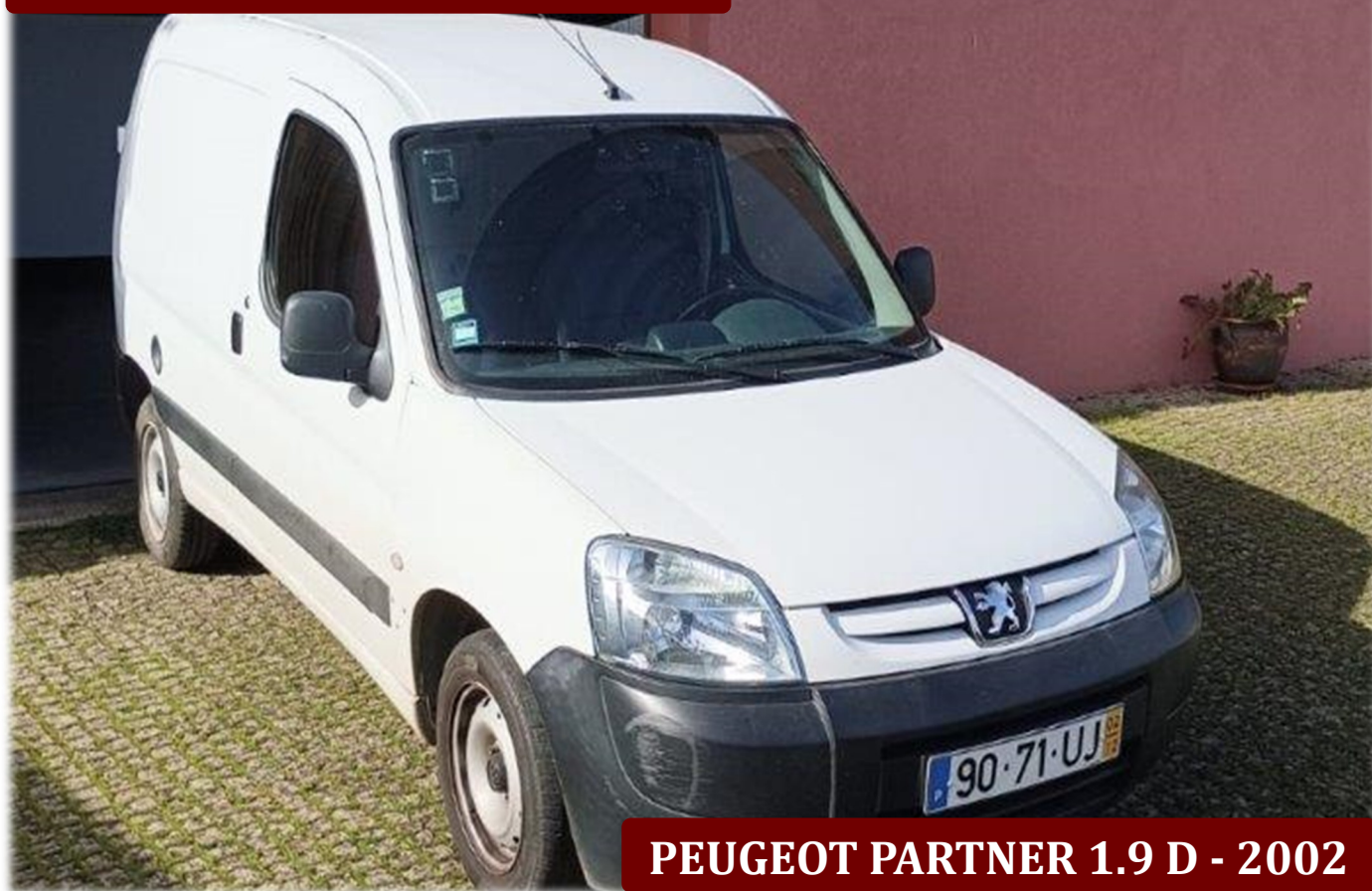
PEUGEOT PARTNER 1.9 D - 2002